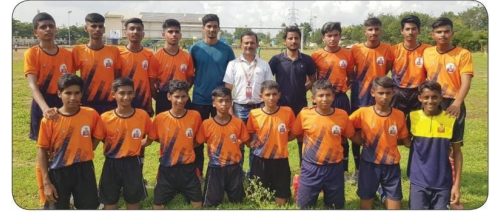
जिल्हास्तरीय सुत्रतो फुटबॉल स्पर्धेत चमकदार कामगिरी केलेला नव कृष्णा व्हॅली स्कूलचा संघ.