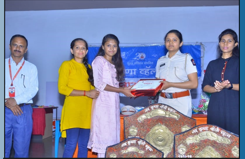
वार्षिक पारितोषिक वितरण सोहळा