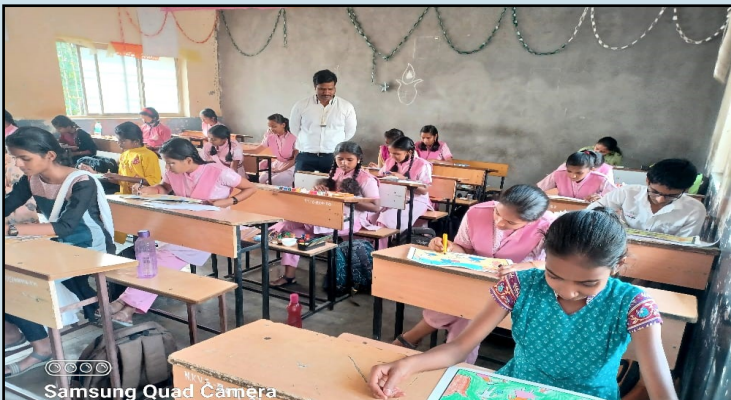
एलिमेंटरी व इंटरमिजिएट ग्रेड परीक्षा

कला संचालनालय, महाराष्ट्र राज्य, मुंबई, यांच्या मार्फत नव कृष्णा व्हॅली स्कूल (मराठी माध्यम) या केंद्रामध्ये(111027) एलिमेंटरी व इंटरमिजिएट ग्रेड परीक्षा सुरु