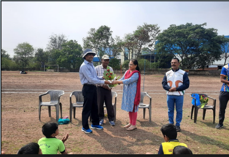
साई मार्फत ॲथलेटिक्स खेळ प्रकाराची निवड चाचणी