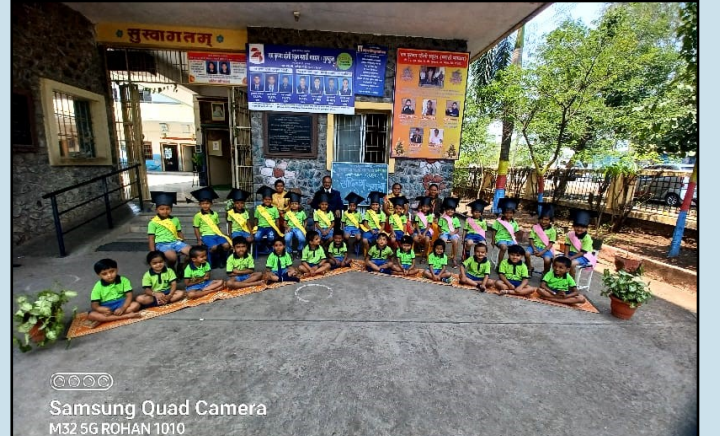
अभ्यास नर्सरी ,लेव्हल वन,लेव्हल टू या मुलांचा सद्विच्छा कार्यक्रम

सुरज फौंडेशन संचलित नव कृष्णा व्हॅली अभ्यास नर्सरी ,लेव्हल वन,लेव्हल टू या मुलांचा सद्विच्छा कार्यक्रम