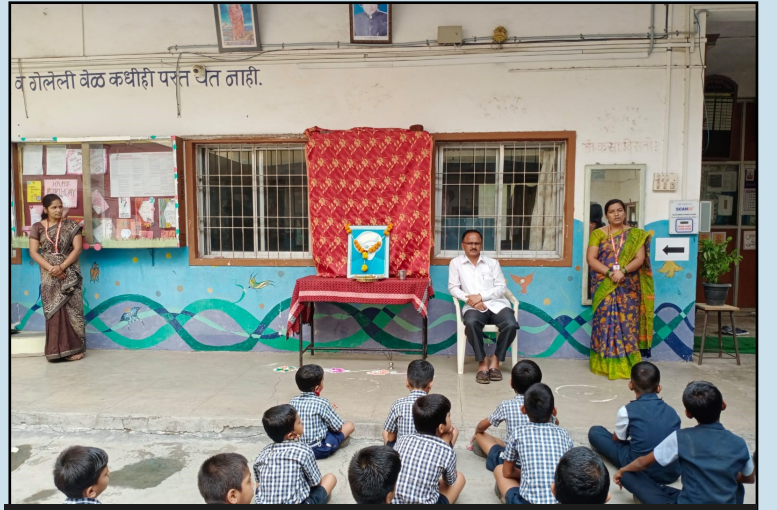
महात्मा ज्योतिबा फुले प्रतिमा पूजन